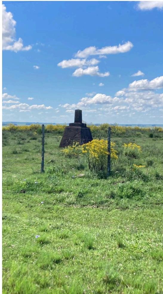
Imagen 2: Foto de la localidad de Masoller y Vila Thomas Albornoz, que muestra un marco que indica un límite fronterizo físico, que no se corresponde con el límite establecido por el alambrado para delimitar la propiedad.

territorio brasileño. Al pasar por este sitio, siempre se cuestiona por qué el alambrado que determina otro límite (el de la propiedad) incluye un “trozo” de territorio Uruguayo.